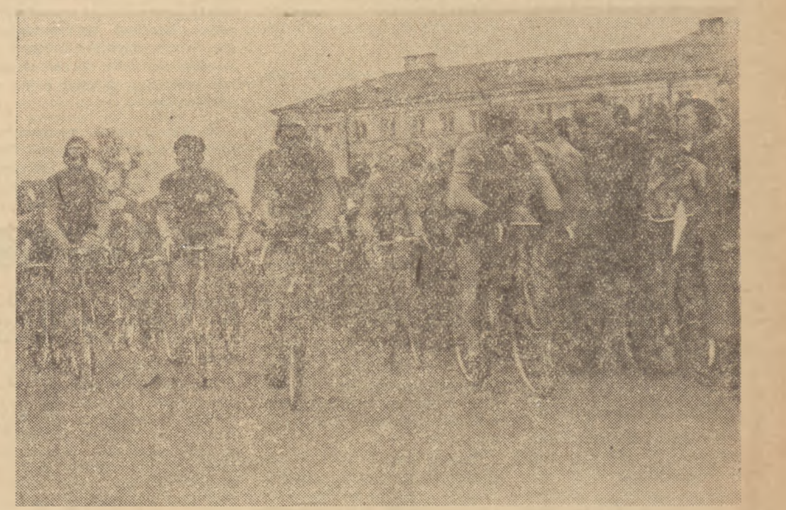
Raidy były imprezą, w której wszyscy umiający jeździć na rowerze mogli wziąć udział. Na zdjęciu: amatorzy kolarstwa wyczynowego brali udział w wyścigach kolarskich. Na zdjęciu: start do zawodów kolarskich w Warszawie na 75 km.

W Raidach Pokoju najliczniej uczestniczyła młodzież szkolna. Na zdjęciu: dziewczęta ze szkół Muranowa w Warszawie na trasie Raidu.