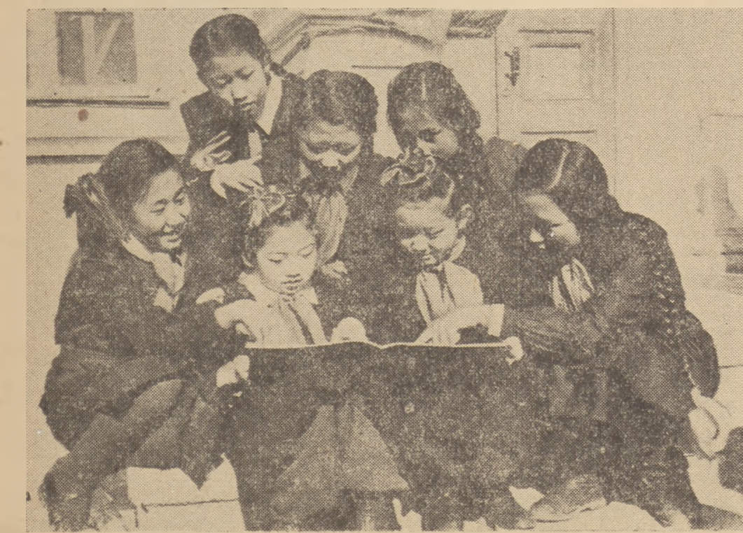
Dzieki troskliwej opiece rządu w Mongolskiej Republice Ludowej nastąpił rozkwit szkolnictwa. Na zdjęciu: uczniowie szkoły im. Czojbalšana w Ulan Bator podczas przerwy w lekcjach.