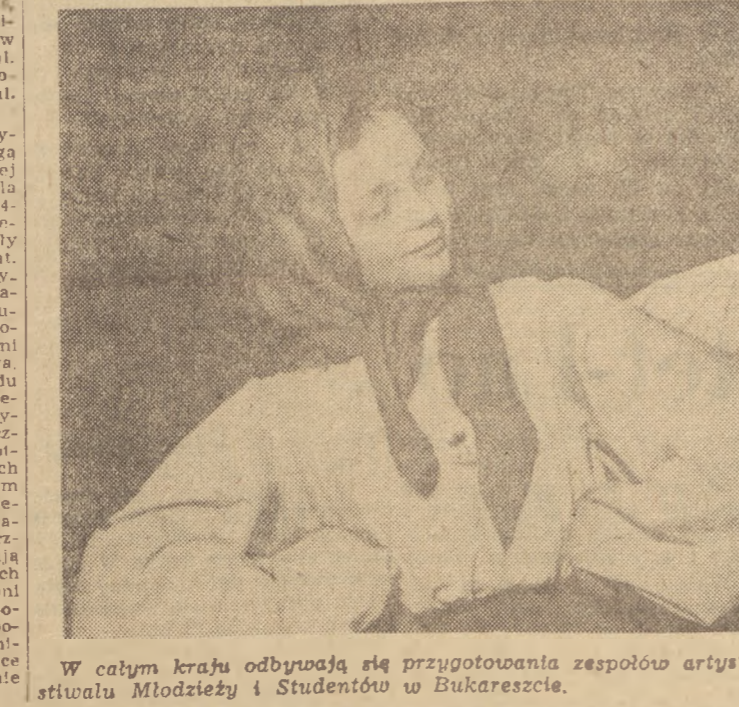
W całym kraju odbywają się przygotowania zespołów artystycznych do IV Światowego Festiwalu Młodzieży i Studentów w Bukareszcie.

Ratunkul Ratunkul! S.O.S! — Ratul Miejska Rada Narodowa nasza pracel... Czysta, Ziowrębna czista, Rada Narodowa ni, Wrocławiu milczy.