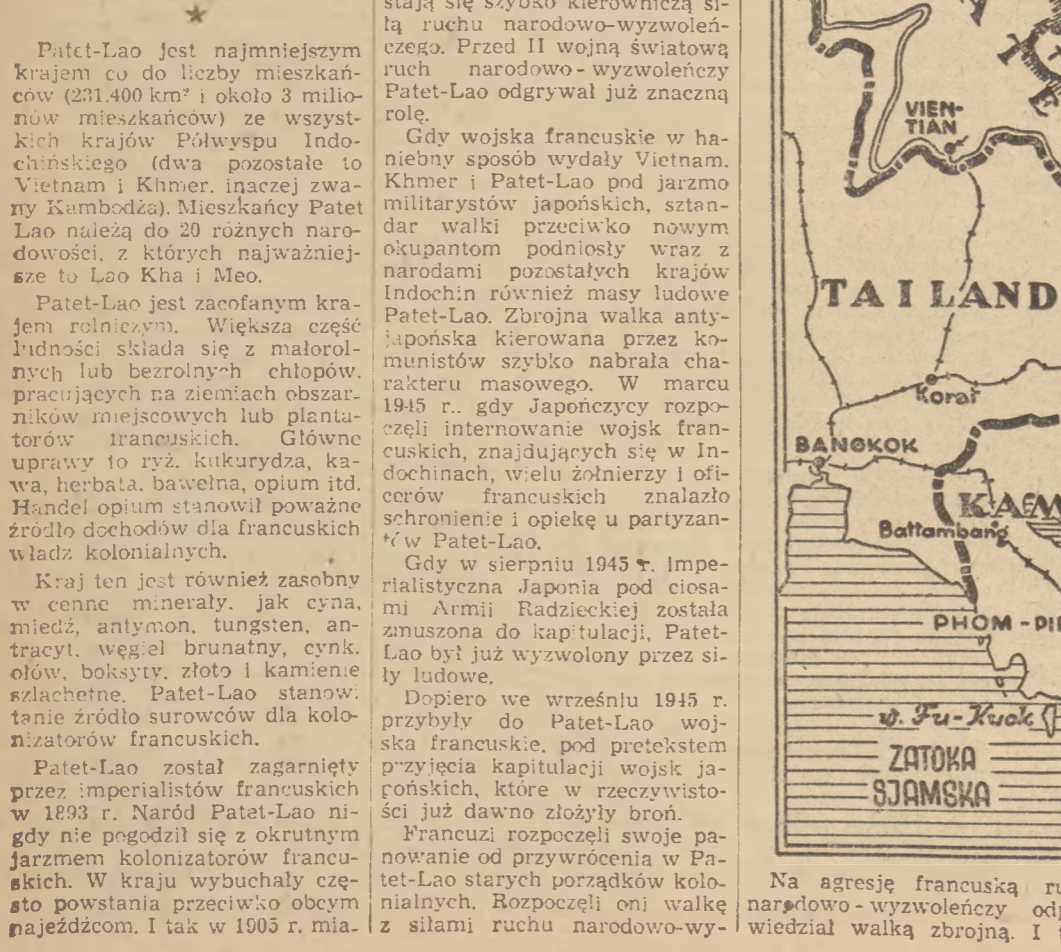
Mapa Laosu i sąsiednich państw. Wykazano granice państw i główne miasta. Skala 1:100 000.