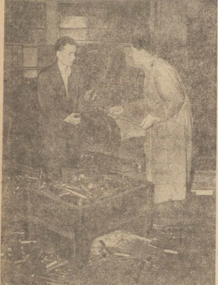
„Górnika z Bąkowskim chodzą od gniazda do gniazda. Ważą w rękach odpady użytkowe...“