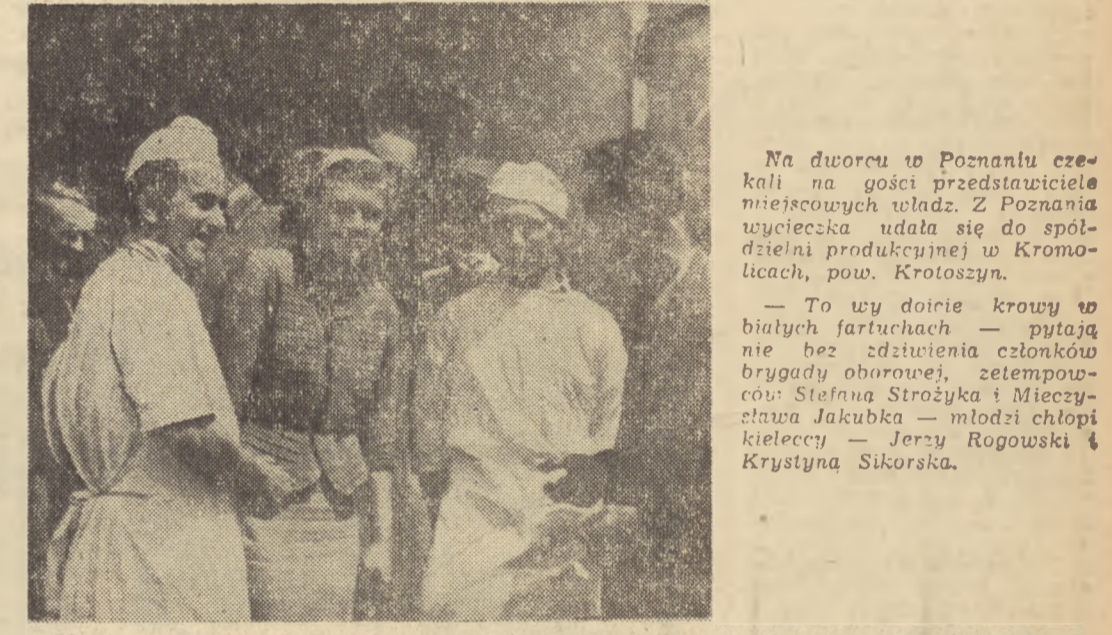
Na dworcu w Poznaniu czekali na gości przedstawiciele miejscowych władz. Z Poznania wycieczka udala się do spółdzielni produkcyjnej w Kromolicach, pow. Krotoszyn.