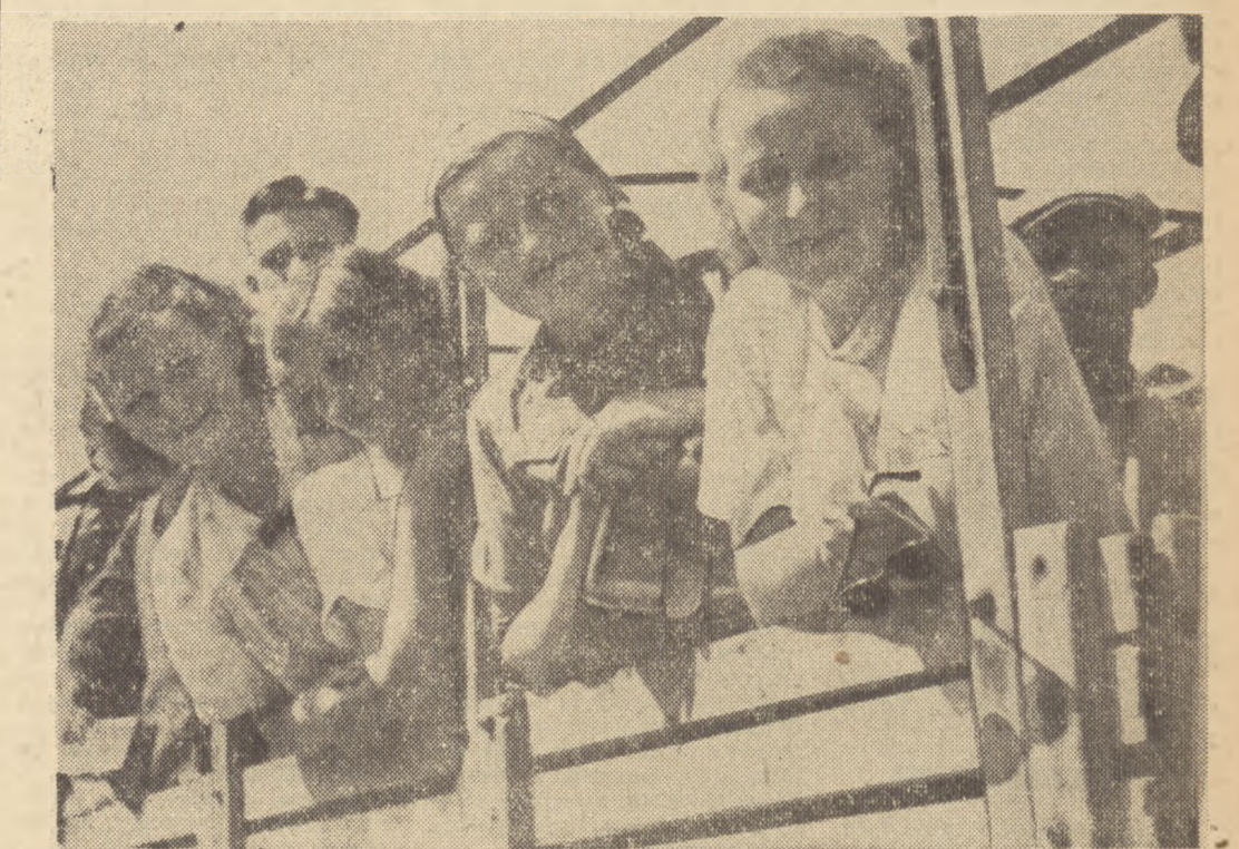
Samochód gotowy już do odjazdu. Ostatnie pożegnania, pozdrowienia i ruszamy w daleką drogę z Jedrzejowa do Kielc, a z Kielc do poznańskich spółdzielni.