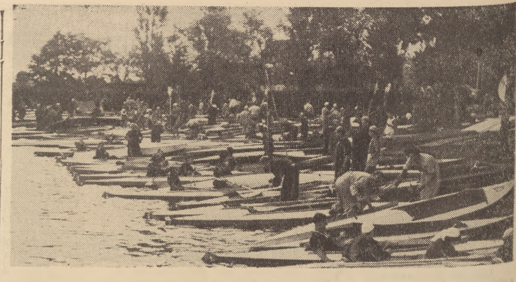
Około 800 kajaków wzięło udział w ogólnopolskim spływie po Brdzie. Na zdjęciu uczestnicy spływu na brzegu jeziora Czarkowskiego.