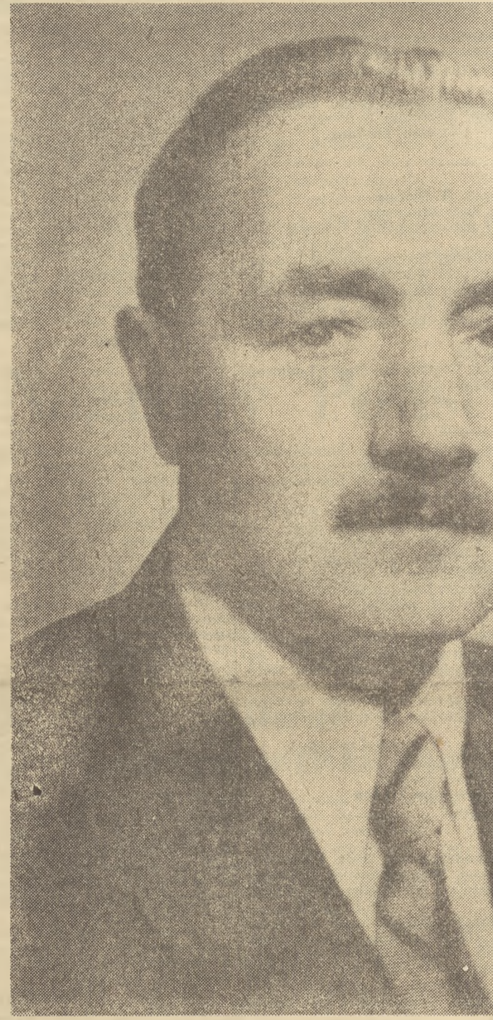
Bolesław Bierut, Prezes Rady Ministrów

Niemal co roku w Święto Odrodzenia Polski naród nasz oddaje w darze swej ukochanej, bohaterskiej, stolicy nową część odbudowanego z ruin miasta. W tym roku mieszkańcy Warszawy otrzymują odbudowany w pełni piękny Rynek Starego Miasta i zespół przylegających do niego kilku ulic — najstarszą historycznie, zabytkową część miasta, pomnik hiszpańskich tradycji oraz walki niepodległościowej i niepodległości wojennym oraz ich protektorom