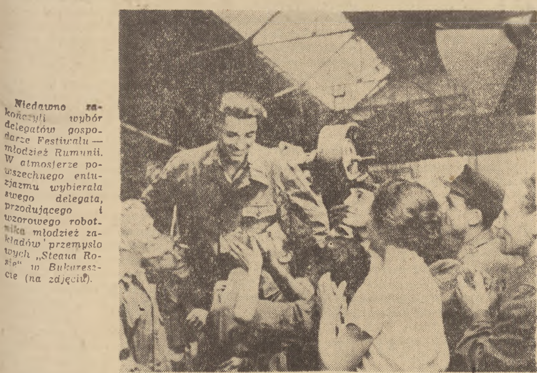
Niedawno zakończyli wybór delegatów gospodarcze Festiwalu — młodzież Rumunii. W atmosferze powszechnego entuzjazmu wybierali swego delegata, produkującego i urozozetego robotnika młodzież zakładowych „Steara Romana” w Bukareszcie (na zdjęciu).