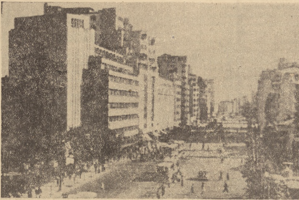
Widok na Bulwar Magheru w Bukareszcie.