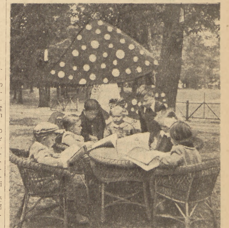
W Dniu Dziecka — w miastach, miasteczkach i wsiach całego kraju odbyły się imprezy dla dzieci. W Warszawie centralna zabawa odbyła się w Parku Kultury na Bielnie. Na zdjęciu: fragment zabawy — dzieci przeglądają wydawnictwa ilustrowane