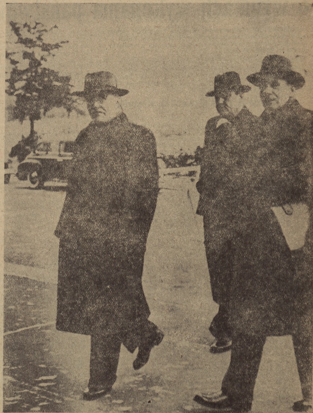
W pierwszym tygodniu konferencji w Berlinie, obrady czterech ministrów spraw zagranicznych odbywały się w gmachu byłej Sojusznicy Rady Kontroli.