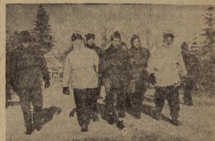
Jazda na nartach dobrze wpływa na samopoczucie zawodników L... ich kondycję. Opr. i foto J. Demantak