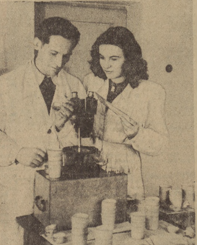
Wojewódzka Stacja Oceny Nasion w Opolu przeprowadza kontrolę jakości nasion...