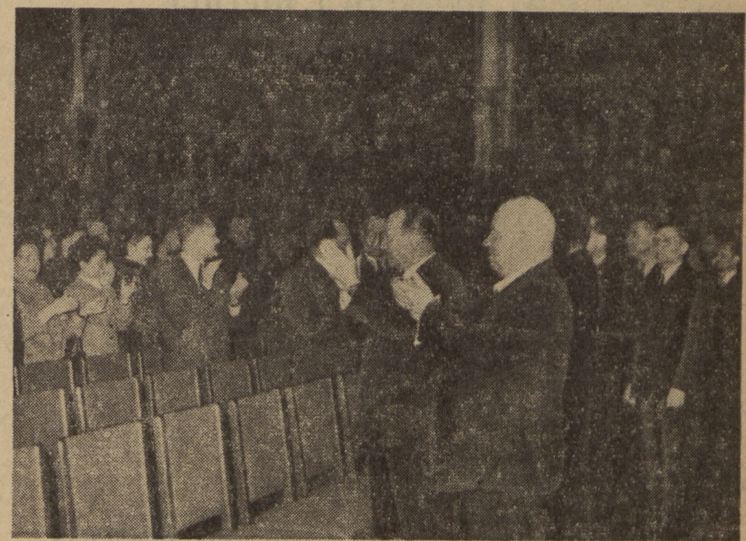
Uczestnicy II Zjazdu Polskiej Zjednoczonej Partii Robotniczej obecni byli dnia 14.III br na koncercie w Hali Mirowskiej. Na koncert przybyli owocnie witani członkowie Biura Politycznego KC PZPR z Przewodniczącym KC PZPR - Bolesławem Bierutem, delegacja Komunistycznej Partii Związku Radzieckiego z I Sekretarzem KC KPZR - N. S. Chruszczowem na czele oraz inne delegacje zagraniczne biorące udział w Zjeździe.

Na tym zakończyły się obrady szóstego dnia II Zjazdu PZPR.