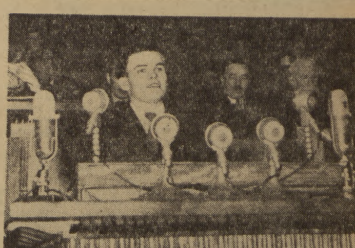
Na trybunie G Skok, przewodniczący Zarządu Wojewódzkiego ZMP w Olsztynie.