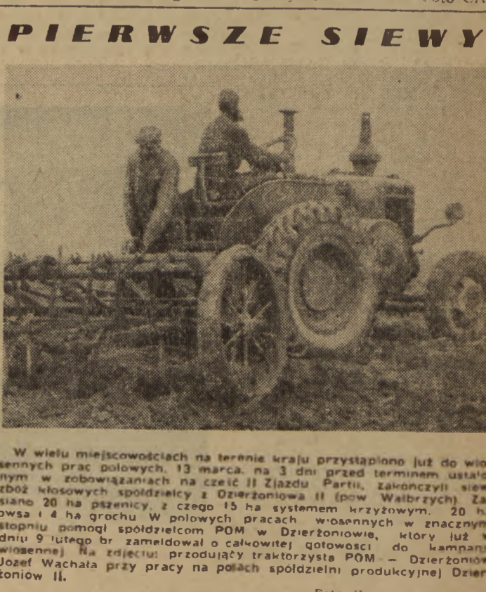
W wielu miejscowościach na terenie kraju przystąpiono już do wiosennych prac polowych, 13 marca, na 3 dni przed terminem ustalonym w zobowiązaniach na cześć II Zjazdu Partii, zakończyli siew zboż wiosennych spółdzielcy z Dzierżonowa II (pow. Wąbrzeźni). Zdjęcie 20 ha pszenicy, z czego 15 ha systemem krzyżowym. 20 ha stopniowo spłodziłom POM w Dzierżonowie, który już w wiosennej na zdjęciu produkują traktorysty POM - Dzierżonowscy. Wachała przy pracy na polach spółdzielni produkcyjnej Dzierżonow II.