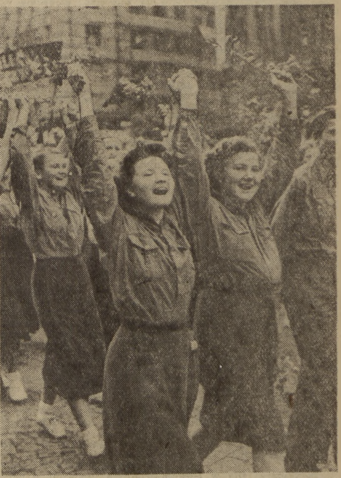
Wiosenny wiatr rozwiewa włosy. Czeskie dziewczęta ze śpiewem marszerują ulicami Pragi.