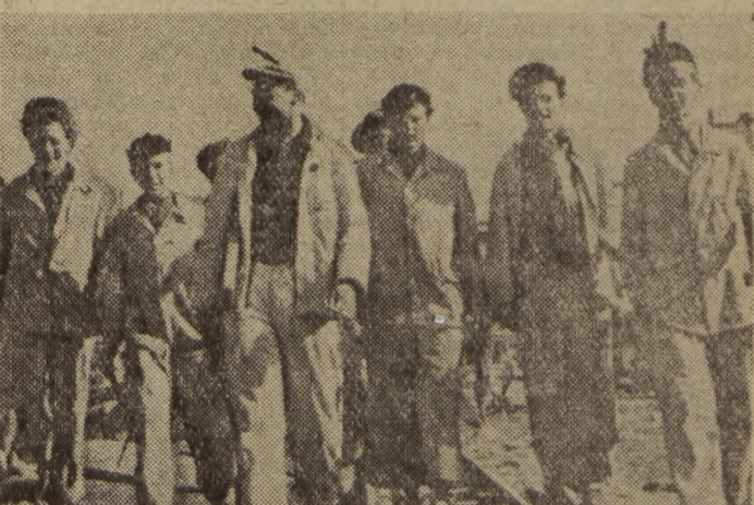
Za kilka dni — 28.III Czesi i Niemcy zobaczą się z nami — swymi polskimi przyjaciółmi na „Spotkaniu przyjaźni” w Jeleniej Górze. Tam gorąco manifestować będziemy wspólną wolę pokojowego zjednoczenia Niemiec i utworzenia nowych Niemiec, które będą ostoją pokoju w Europie.