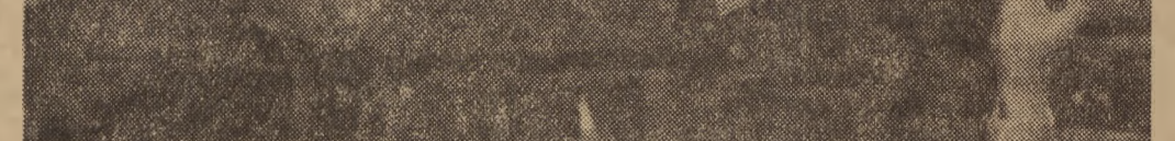
Wzrost i rozwój sztuki ludowej w Zakopanem

W ten sposób możemy znaleźć odmianę, która jest najbardziej odporna na choroby i szkodniki, a także, która daje nam najlepszy efekt.