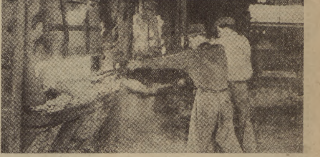
Jako pierwsza w hutnictwie stanęła do współzawodnictwa ku użeczeniu Święta 1 Maja zalogi hut „Bobrek”, zobowiązując się dać m. in. 1 tys. ton stali ponad plan II kwartału br. Na zdjęciu: przy piecu martenowskim w stalowni.