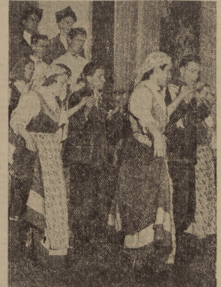
1 Dla uczniów warszawskiego Technikum Radiokomunikacyjnego zgromadzone na scenie przed publicznością, był niezwykłym wydarzeniem. Podczas rejonowych eliminacji zdali go jednak na bardzo dobrze i zakwalifikowali się do eliminacji okręgowych. Systematyczne próby w wietliwej połączonych występów w zakładach pracy w okresie przedzjazdowym uwieńczone zostały sukcesem.

Zasadnicze szkoły mechanizacji rolnictwa będą kształciły wykwalifikowanych traktorzystów-mechaników, posiadających dąży zasób wiedzy z dziedziny agronomicznej. Uczniowie tych szkół będą mieli w czasie odbywania nauki zapewniony internat, a większość z nich otrzyma stypendia.