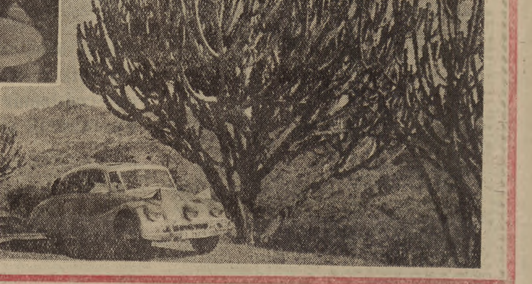
Fot. 3. „Droga prowadzi wśród egzotycznych drzew”.

Katastrofa brytyjskiego samolotu odrzutowego LONDYN. Brytyjski pasażerski samolot odrzutowy typu „Comet”, kursujący na szlaku Londyn-Johannesburg spadł do morza w odległości 90 km na południe od Neapolu. Ny pokładzie samolotu znajdowało się 14 pasażerów i 7 członków załogi. Wszyscy zginęli. Angielski lotnikowski „Eagle” wylądował z morza zwołki 6 ofiar.