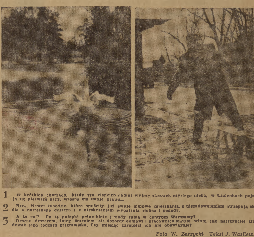
1 W krótkich chwilach, kiedy zwa ciężkich chmur wyjrzy skrawek czystego nieba, w Łazienkach pojawiają się pierwsze psy. Wiosna ma swoje prawa... 2 Brr... Nawet łabędzie, które opuściły już swoje zimowe mieszkania, z niezadowolonym otępieniem strzepują skrzydła z natrętnym wypatrzeniem słońca i pogody. 3 A to co? Co te patupki pełne błota i wody robią w centrum Warszawy? Deszcz deszczem, śnieg śniegiem, ale dozory domowi i pracownicy MPOM winni jak najszybciej zlikwidować tego rodzaju grzązawiska. Czy miesiąc czystości ich nie obowiązuje? Tekst J. Wasilewski