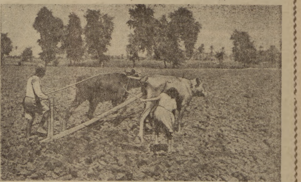
Życie fellaha nie wlepieł zmiemie. Takie metody uprawy roli zna nie tylko od 5 tysięcy lat.

*) Opracowane na podstawie książki J. HANZELKI i M. ZIMKUNDA pt. „Afryka snów i rzeczywistości” (wyd. Praha 1953) — przez Z. Mikolajczaka i Z. Nowaka. **) fellah — (arab) chłop, rolnik egipski.