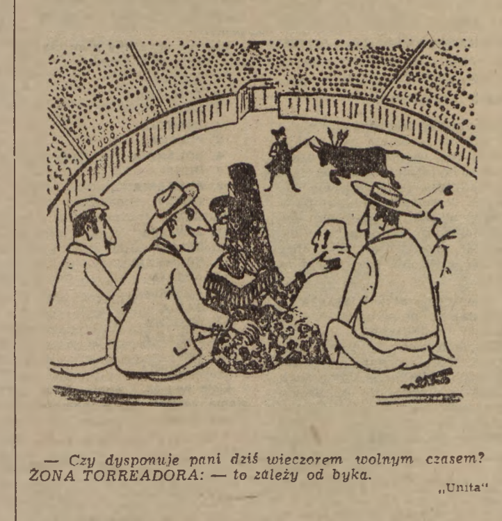
— Czy dysponuje pani dziś wieczorem wolnym czasem? ZONA TORREADORÁ: — to zależy od byka. „Unita”