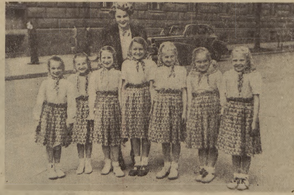
Ostatnio odbyły się eliminacje wojewódzkie zespołów artystycznych szkół podstawowych i liceów ogólnokształcących województwa łódzkiego. Pierwsze miejsce zajął zespół ze szkoły podstawowej w Razyżu. Wyjeżdża na eliminacje centralne w Warszawie.

gospodarzy, a na maszyny do młocki — 10 gospodarzy. W Lipiu dotychczas żniwiarek nie używano. W br. na pola podjęto przedsięwzięcia maszynowe. Po przeanalizowaniu wraz z starszymi wszelkimi możliwościami po zawarciu umów ZMP-owcy podjęli uchwale, w której m. in. czytamy: O cztery dni przed terminem zakończyć żniwa. W tym celu zawierają umowę z GOM-em. Równocześnie zorganizujemy trzy 8-osobowe grupy kołowe, które będą zespołowo przy pomocy żniwiarek dokonywały sprzętu zboża. Dokonamy wedy Władysławy Mazur i w innych gospodarstwach.