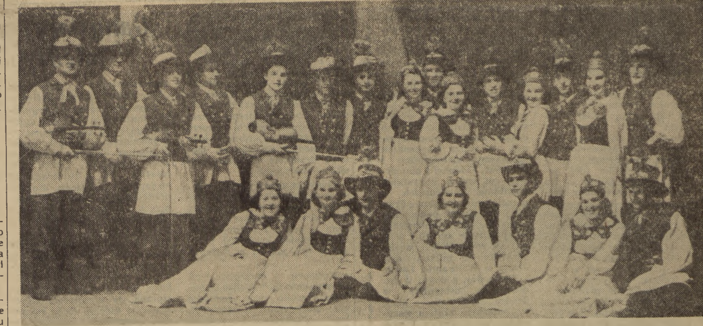
Na uroczystościach obchodu 10-lecia wyzwolenia i 600-lecia Rzeszowa wystąpił z programem m. in. 140 par tanecznych i 700 osobowy chór. Na zdjęciu: zespół pieśni i tańca regionu krośnieńskiego z f-ki obuwa w Krośnie.

W Rzeszowie wybudowano liczne, wspaniałe gmachy użyteczności publicznej, a m. in. 7-piętrowy gmach Prezydium WRN, 5 przedszkoli, 2 szkoły podstawowe, 1 zawodowa, kilka internatów, wspaniały Dom Kultury na osiedlu WSK.