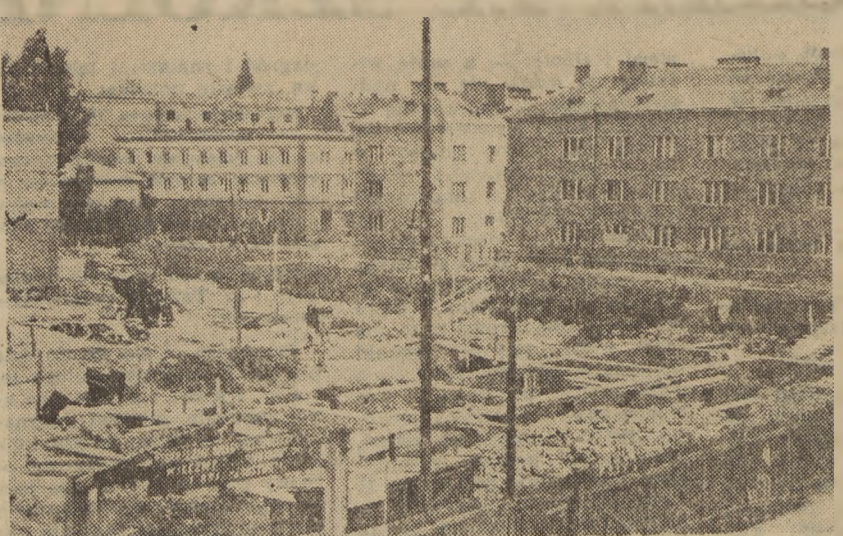
Szybko rosną w górę mury nowego miasta. Na zdjęciu obok fragment nowego osiedla mieszkaniowego na WSK.

W związku z wymianą artystów cyrkowych między Polską a krajami demokracji ludowej, przybyła do stolicy w dniu 30 bm. reprezentacyjna czechosłowacka ekipa cyrkowa.