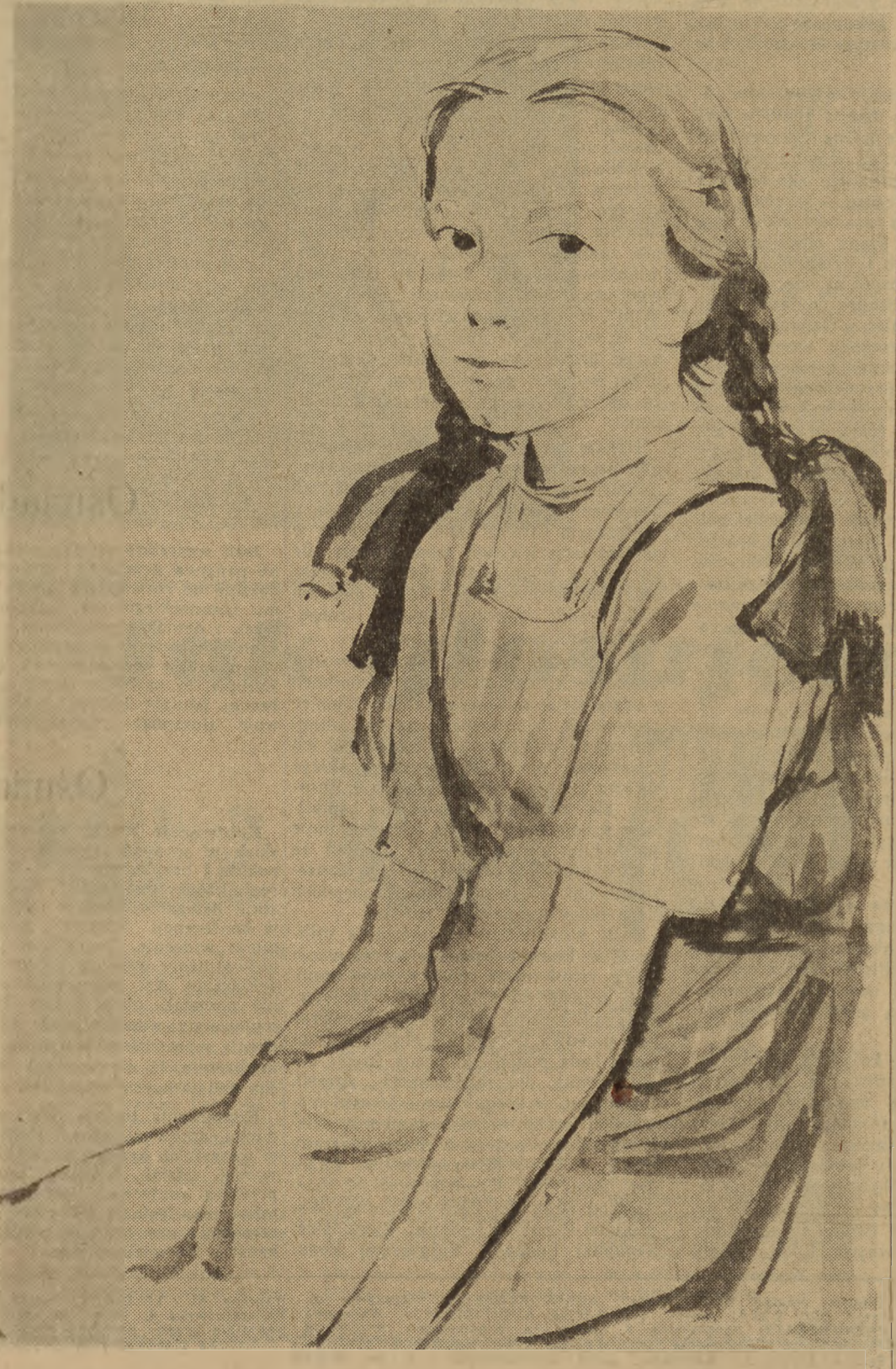
Rysował A. Kobzdej

dziś gdy władza ludowa dała młodzieży prawo głosu razem z prawem do pracy, nauki i kultury — burżuazyjne niedobitki usiłują odwrócić zainteresowanie młodzieży od wyborów, zaszczepiać bierność młodzieży wobec jej najżywniejszych spraw. Niedoczekanie wszystkich, którzy liczyli na bierność kogokolwiek z młodych! Chłopcy i dziewczęta jak jeden mąż pójdą do urn i oddadzą swe głosy na kandydatów Frontu Narodowego, przeciwko wrogom Ojczyzny! Głosujemy za programem, który przynosi nowe świetlice, biblioteki, kina, szkoły i boiska sportowe, abyśmy pełniej niż dotychczas mogli korzystać z szerokiej możliwości rozwijania kultury i zdobywania wiedzy! Głosujemy za programem, którego gwarancją jest nasza własna praca i ścisłe współdziałanie z naszymi radnymi i radami, a więc który będzie w pełni wykonany! Młodzież polska jednomyślnie odda swe głosy na kandydatów Frontu Narodowego wyrażając wolę pełniejszego udziału w rządzeniu swoim krajem, w tworzeniu swej przyszłości! Niech ani lednego młodego wyborcy nie zabraknie przy urnach! Głosujemy na kandydatów Frontu Narodowego!