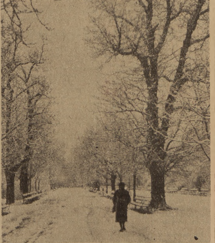
Fragment Parku Ujazdowskiego.

nionych do głosowania, a w 6 gromadach wybrano mniej niż połowę radnych. W związku z tym w tych 11 gromadach, zgodnie z przepisami art. 78 i 79 ordynacji wyborczej do rad narodowych, przeprowadzone będą ponowne wybory do gromadzkich rad narodowych.