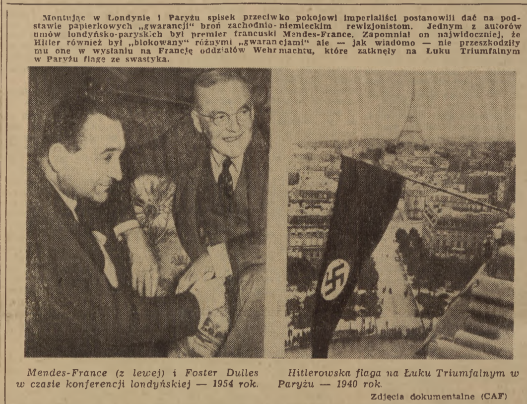
Mendes-France (z lewej) i Foster Dulles. Hitlerowska flaga na Łuku Triumfalnym w czasie konferencji londyńskiej - 1954 rok. Paryżu - 1940 rok.