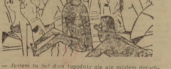
— Jestem tu już dwa tygodnie ale nie miałem dotychczas okazji zobaczyć morza. (Avanguardia)

Piątek i Olejński po zwycięstwie z Dobesem i Maslancem CSR 6:2; 6:3; 5:1, przegrali ze Stoianem i Suskiem CSR 1:6; 4:6.