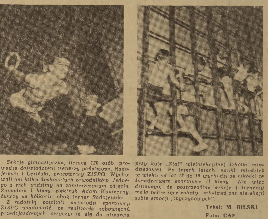
Sekcje gimnastyczną, liczącą 120 osób, prowadzi doświadczony trener państwowy...