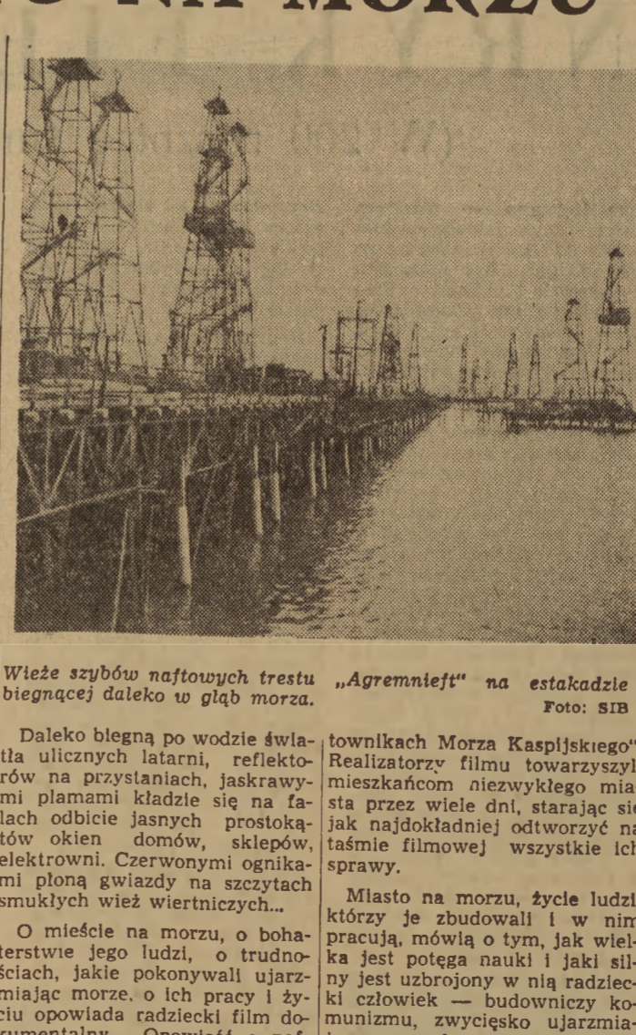
Wieża szypów naftowych trestu „Agremnief” na estakadzie biegnącej daleko w głąb morza.