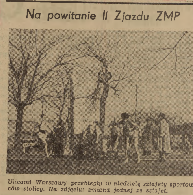
Ulicami Warszawy przebiegły w niedzielę sztafety sportowców stolicy. Na zdjęciu: zmiana jednej ze sztafet.