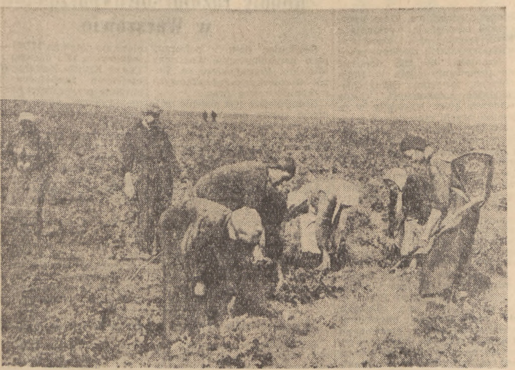
Lustracja pól w PGR Jurandów, zespół Maszewo (woj. szeciński). Na zdjęciu niszczenie wykrytego ogniska stonki ziemniaczanej.