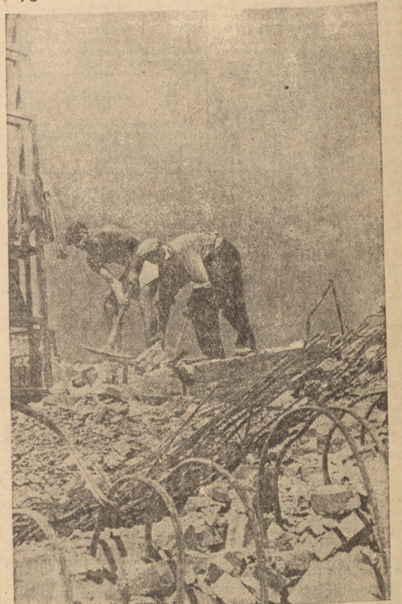
Na terenie ograniczonym ulicami: Nowym Światem, Al. 3 Maja i Książęcą, rozpoczęły się prace przygotowawcze do budowy Centralnego Domu Zjednoczonej Partii Klasy Robotniczej. Fragment prac rozbiórkowych na terenie przyszłej budowy