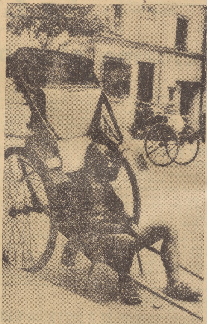
Kulis-rykszarz, korzystając z wolnego czasu wypoczywa na ulicy Shanghaju, by znów za chwilę zamienić się w zwierzę i wozic kuomintangskich czy też amerykańskich panów.