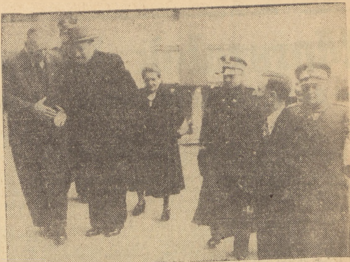
Prezydent Bierut, marszałek Rokossovski i marszałek Zymierski wchodzą do gmachu Sejmu, witani przez wicemarszałków Barcikowskiego i Zambrowskiego

Dzięki użyciu energii atomowej do realizacji twórczych planów pokojowych, których wykonania podjęli się inżynierowie radziec-