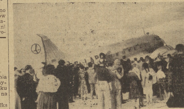
W ramach wczorajszych pokazów na lotnisku we Wrzeszczu odbyły się bezpłatne przejażdżki samolotami „Lot-u” dla przodowników pracy i racjonalizatorów

Dziennik „Oesterreichische Volksstimme” podkreśla, że władze austriackie zwolniły tego zbrodniarza wojennego na bezpośredni rozkaz Amerykanów