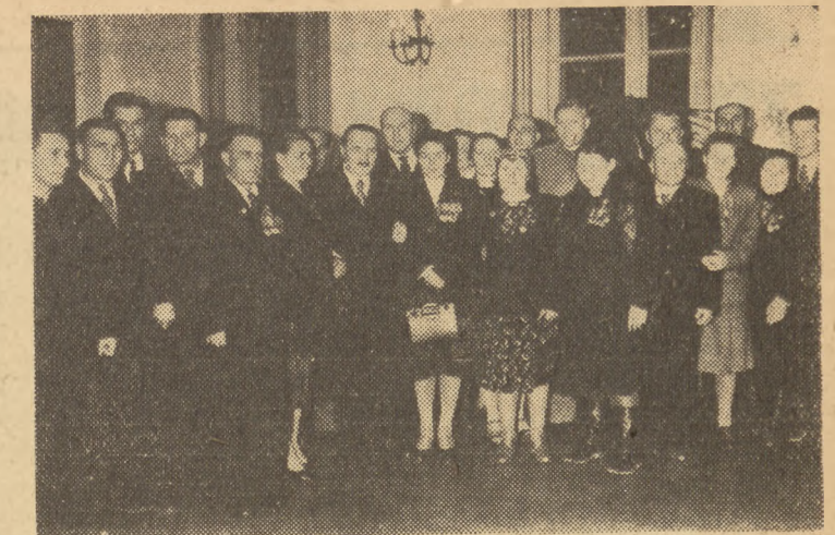
W dniu 27 bm. Prezydent RP Bolesław Bierut gościł w gmachu Rady Państwa delegację kolchoźników radzieckich. Na zdjęciu: Prezydent RP, Bolesław Bierut i Marszałek Polski Konstanty Rokossowski w otoczeniu kolchoźników.