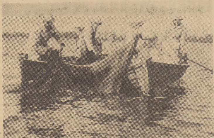
Polscy sielaw na jeziorach mazurskich w zespole PGR „Mamry” koło Giżycka. Na zdjęciu: zastawianie sieci na jeziorze „Mamry” przez brygadę rybacy Kieczygi. (Foto—AR).