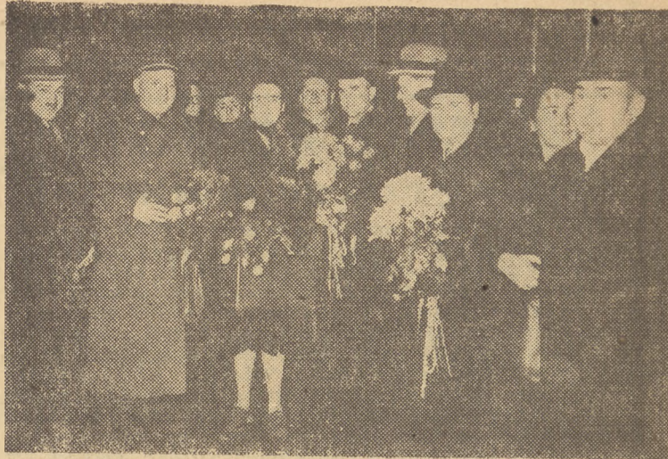
Dnia 5 bm. przybyła do Warszawy delegacja radziecka, która weźmie udział w obchodach Miesiąca Pogłębień Przyjaźni Polsko-Radzieckiej.

Imperialiści anglo-amerykańscy prowadzą politykę rozpętania nowej wojny światowej. Nieokielznani w swych zapędach podżegacze wojenni przeszli obecnie do bezpośrednich aktów agresji, rozpętawszy krwawą interwencję przeciwko narodowi