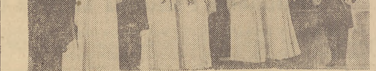
Pięknym uroczajaniem akademii ku cześć 33 rocznicy Rewolucji Październikowej w Gdańsku były występy artystyczne. Na zdjęciu: scena z tańca gruzińskiego.

Od kilku już dni punkty wymiany pieniędzy w trójmieście świecą pustkami. Posze-