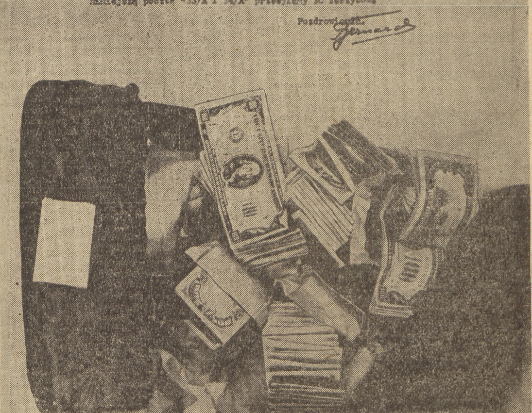
30 „zeszytów“ — 30 srebrników — przestanych przez wywiad amerykańsk. „Krajowej organizacji WIN“ na cele dywersji i szpiegostwa w Polsce. (Na str. 4 podajemy materiały ze zbioru dokumentów zawartych w archiwum WIN.)