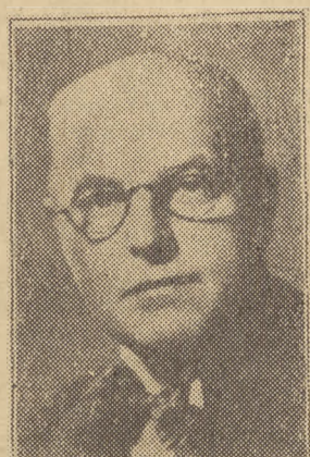
DENNIS NOWELL PRITT

prawnik, wybitny angielski działacz społeczny, przewodniczący Międzynarodowego Zrzeszenia Prawników-Demokratów. Znaną powściągnął jego zasługi jako demaskatora niemieckich zbrodniarzy wojennych. Jako świadek prawdy zostały na całym świecie powitane broszury Pritta o wojnie w Korei.