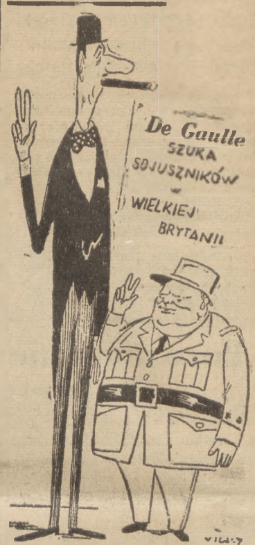
Sojusznicy... („News Chronicle“)