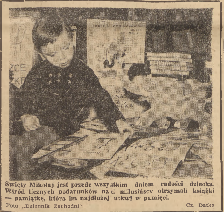
Święty Mikołaj jest przede wszystkim dniem radości dziecka. Wśród licznych podarunków na... milusińscy otrzymali książki — pamiątkę, która im najdłużej utkwi w pamięci. Cz. Datka