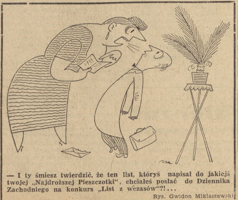
— I ty śmiesz twierdzić, że ten list, któryś napisał do jakiejś twojej „Najdroższej Pieszczotki”, chciałeś posłać do Dziennika Zachodniego na konkurs „List z czasów”?!... Rys. Gwidon Miklaszewski

Moskwa. Jak już donosiliśmy, również rząd węgierski zwrócił się do rządu ZSRR z prośbą o zmniejszenie reparacji. W związku z tym minister spraw zagranicznych ZSRR Mołotow wystosował do ministra spraw zagranicznych Węgier list, w którym zawiadoma go, iż rząd radziecki, powołując się na chęć ulżenia wysiłkowi narodu węgierskiego w dziele odbudowy i rozwoju gospodarki narodowej i biorąc pod uwagę przyjazne stosunki między obu krajami, postanowił zmniejszyć o 50 procent sumy, pozostającej do wypłaty z tytułu reparacji