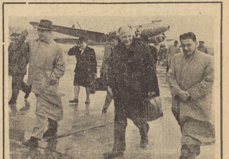
Do Polski przybył na zaproszenie TUR-u poseł do brytyjskiego parlamentu K. Ziiliacus. Wygłosił on w szeregu miast odczyty o sytuacji klasy robotniczej w Anglii. Zdjęcie przedstawia posła Ziiliacusa na warszawskim lotnisku.

Bochnia (tel. wł.) Wody w największym ciągu przybierają. W ciągu 3 ostatnich godzin poziom podniósł się o 4 metry. Stan obecny wynosi 9 metr. Cztery mosty zostały zerwane. (Dokończenie na str. 2)