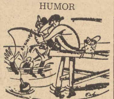
HUMOR — Nie urzeszcz pan tak...! Spłszy pan mi wszystkie ryby! (Miada Franta)

siedleńcze w Urzędach Wojewódzkich. Ci, którzy się osiedlili na Ziemiach Dawnych (to jest leżących przed 1939 r. w granicach Państwa Polskiego), muszą się w tej sprawie zwrócić do Okręgowych Urzędów Likwidacyjnych. Dla Pana właściwym jest O. U. L. w Katowicach, mieszczący się w Urzędzie Wojewódzkim.