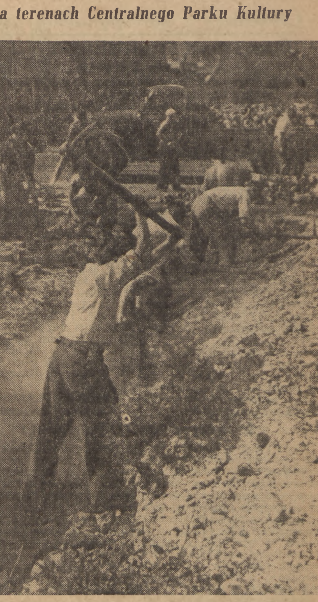
Ludność stolicy z entuzjazmem uczestniczy w społecznej akcji budowy Warszawy. Na zdjęciu: prace odgruzowawcze na terenach Centralnego Parku Kultury na Powiślu.