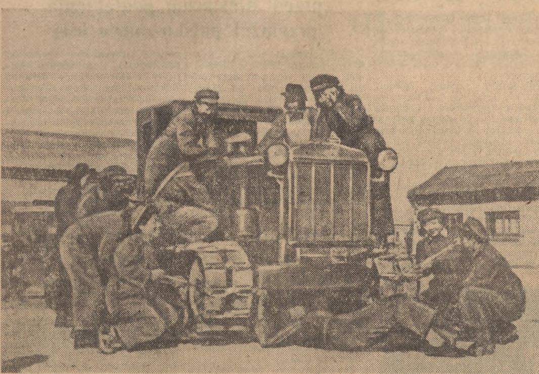
We wszystkich prowincjach Chin Ludowych zostały zorganizowane kursy rolnicze, na których wiesniacy chiński przechodzą przeszkolenie z dziedzin nowych zdobyczy agrotechnicznych. W jednej tylko prowincji Szantung 40.000 chłopów ukończyło kursy rolnicze. Na zdjęciu: kobiety traktorystki uczą się wszelkich rodzajów pracy przy prowadzeniu i utrzymaniu traktora.