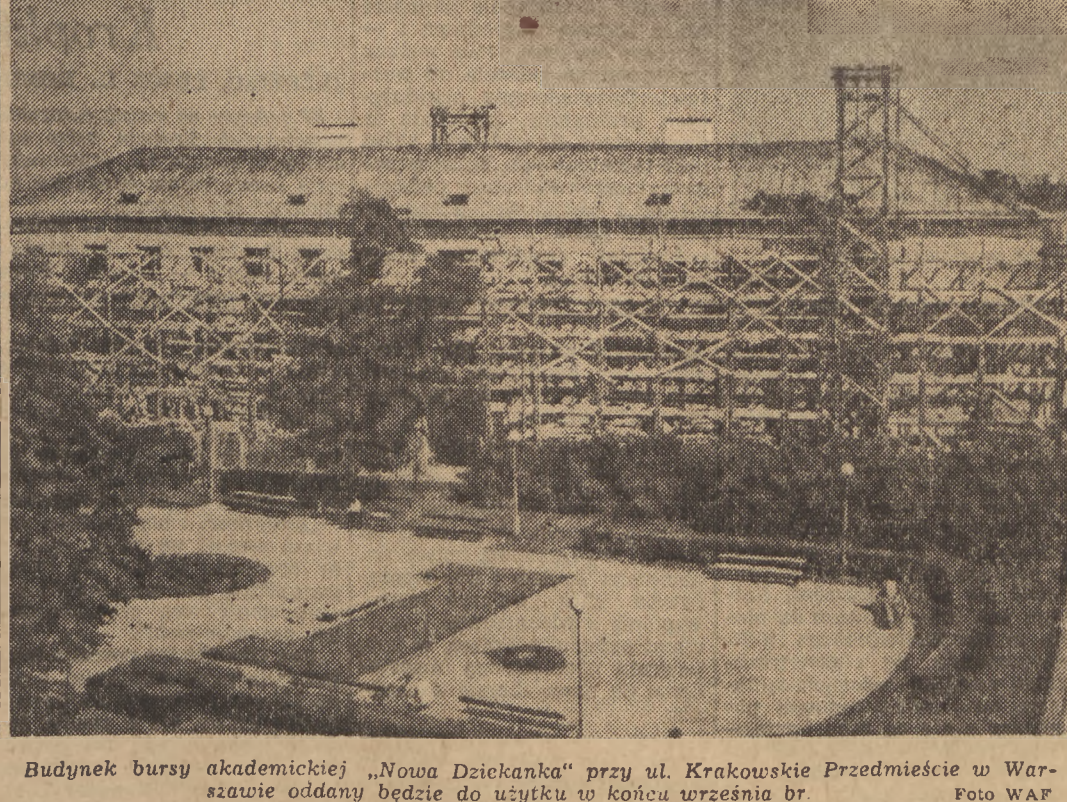
Budynek bursy akademickiej „Nowa Dziekanka” przy ul. Krakowskie Przedmieście w Warszawie oddany będzie do użytku w końcu września br.