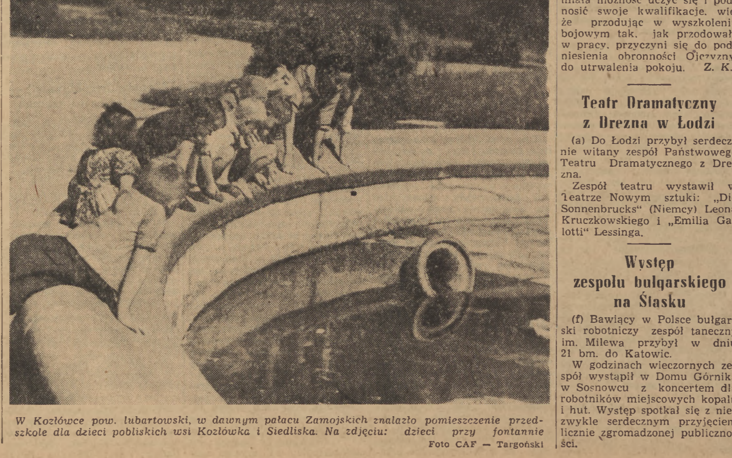
W Kozłowie pow. lubartowski, w dawnym pałacu Zamojskich znalazło pomieszczenie przedszkole dla dzieci polubskich wsi Kozłowska i Siedliska. Na zdjęciu: dzieci przy fontannie